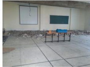
UNIVERSITÉ ABDELMALEK ESSAADI - AVANT