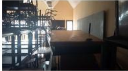
UNIVERSITE CADI AYYAD - AVANT